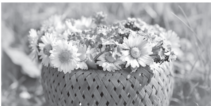
Für das vhs-Team Barbara Ehrenstorfer

Wir wünschen Ihnen schöne und sonnige Frühlingstage!