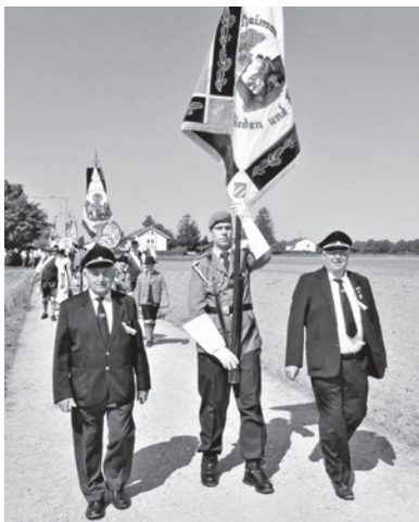
Die Fahnenabordnung des SKV Poing- Angelbrechting e.V.

Am 08.06.2023 beginnt die diesjährige Fronleichnamprozession beim Moarhof, Anzinger Str.3 um 08:30 Uhr. Der SKV wird auch daran teilnehmen, wir bitten unsere Mitglieder um zahlreiche Teilnahme.