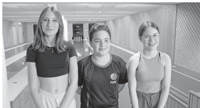
Foto: 3. Platz Jugendturnier