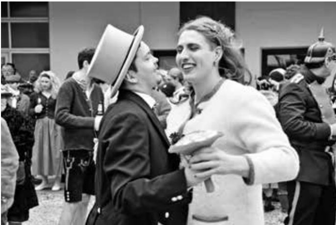
Das Brautpaar beim Hochzeitstanz.

Als der Umzug im Vorhof der Anni-Pickert-Schule ankam, heiratete das Brautpaar, nachdem sich Standesbeamter und Geistlichkeit auf ein Procedere geeinigt hatten, vor hunderten von Zuschauern. Zum Schluss warf die Braut noch ihren Brautstrauß ins Publikum, wo sich viele Hände nach der Trophäe streckten. Und weil der Brauch besagt, dass der Fänger des Brautstraußes als nächstes heiraten wird, war dieser letzte Akt der Poinger Bauernhochzeit hoffentlich ein Vorzeichen darauf, dass diese wunderbare Tradition in 5 Jahren fortgesetzt wird.