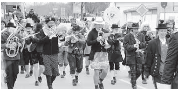
Eine saubere Hochzeitsgesellschaft!

Alles ist hier verkehrt, Buam als Madln und Madln als Buam?! Nein, nein, es ist zum Staunen, welche Musikerschönheiten sich doch so bei uns verstecken!