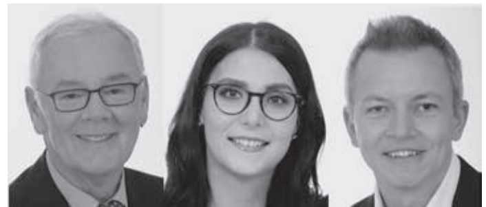
Ludwig Berger Platz 1