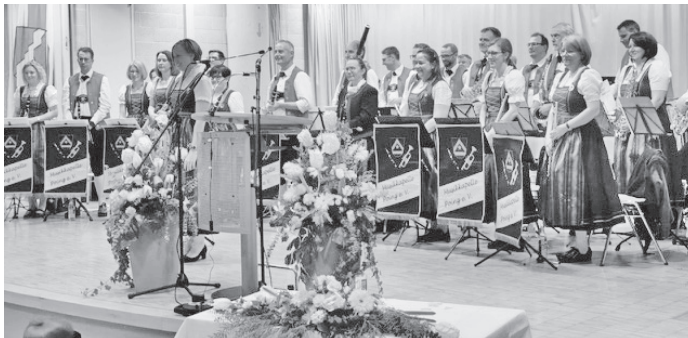
Beim Neujahrsempfang in Poing, 2023

Liebe Leserinnen und Leser, vergangenes Wochenende hatten wir unseren ersten Auftritt in diesem Jahr. Wir durften den Poinger Neujahrsempfang in der Aula der Anni-Pickert-Grund- und Mittelschule musikalisch untermalen. Hierfür hatte sich unsere Dirigentin Angela ein schwungvolles Programm einfallen lassen, unter anderem mit dem Medley „80er Kult(tour)“ und dem Marsch „Viribus Unitis“ (mit vereinten Kräften). Außerdem schreiten die Planungen und Vorbereitungen für unser Jubiläumsjahr immer weiter voran. Ein Teil davon wird selbstverständlich unser Frühjahrskonzert „Legenden“ am 25.03.23 sein, für das wir fleißig proben. Wir freuen uns schon jetzt sehr darauf! Unsere aktuellen Termine finden Sie auch jederzeit auf unserer Homepage unter https://www.musikkapelle-poing.de/Termine.php .