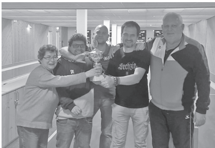
Siegerteam Poinger Löwen

Ein weiterer Punkt zum Jubiläum ist die Einladung von Gästen, um unseren schönen Kegelsport den Gästen etwas näher zu bringen. Begonnen haben wir unsere Aktion – Family & Friends- mit den Poinger Löwen. Es war eine sehr lustige Veranstaltung und bei allen Teilnehmern/innen wurde spielerisch der Ehrgeiz geweckt. Es war erfreulich, dass auch einige vielversprechende Talente unter den Löwen Fan's waren und wir hoffen, dass diese Talente auch mutig sind um unser Angebot einige Trainingseinheiten kostenlos mit Trainern anzugehen auch wahrnehmen. Nur wer es ausprobiert, kann sich ein Urteil erlauben.