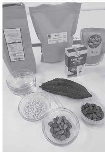
Schulklassen im Weltladen

Anfang Dezember durften wir nach langer Zeit endlich wieder Schulklassen bei uns im Weltladen begrüßen! Schüler*innen der 4. Klassen der Anni-Pickert-Schule besuchten uns zu einem kleinen Schokoladen-Workshop: wir haben zusammen den Weltladen besichtigt, über den fairen Handel gesprochen, die Herkunft der Produkte nachverfolgt und dabei das Augenmerk insbesondere auf Kakao und natürlich Schokolade gelegt.