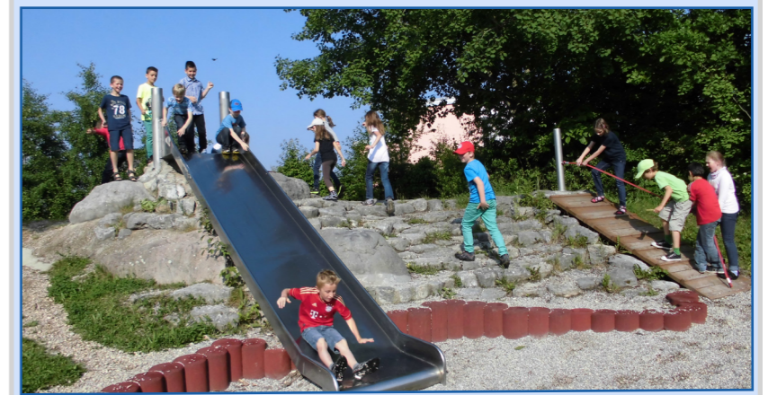
Spielplatz Rutsche im Grünzug