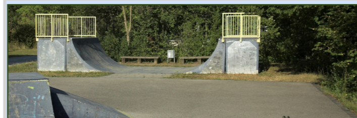
Skateanlage „Am Hanselbrunn“