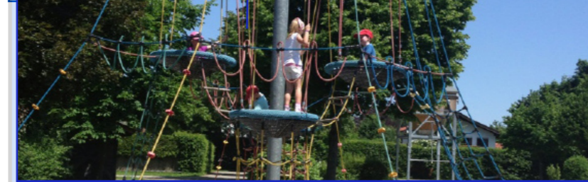
Poing Süd „Poli“ an der Markomannenstraße